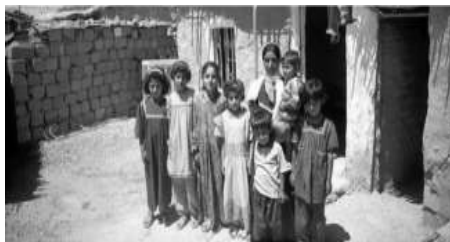
Dankurd sponsorerer børn fra familier der står uden forsørger. Støtten udbetales direkte til familien hver måned.

KSC sørger for at følge de sponserede børn og sikrer at den økonomiske hjælp kommer i de rigtige hænder.